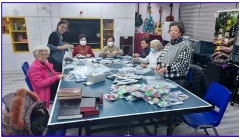
婦女會幫手包裝報佳音福音包

24/12 崇拜後，平安夜的下午，一行 36 人在牛頭角區唱詩歌，帶出福音喜樂的信息。