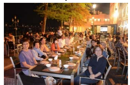
最後一站，美景及美味的泰國菜

及義工，於 14/12 在安老院【采晨琚】探訪，其間獻唱福曲及見證分享，將耶穌降生的福音帶給院友。