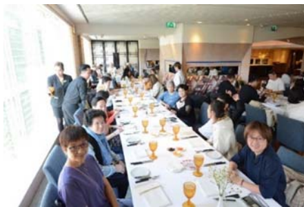
一起享受特色葡式午餐