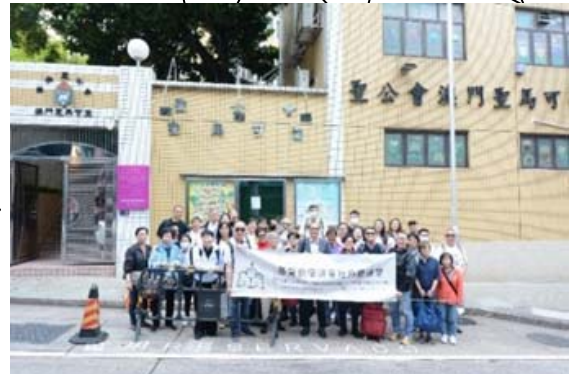
全體 36 人到達聖公會澳門聖馬可堂