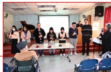
當天三堂弟兄姊妹濟濟一堂，在粉嶺