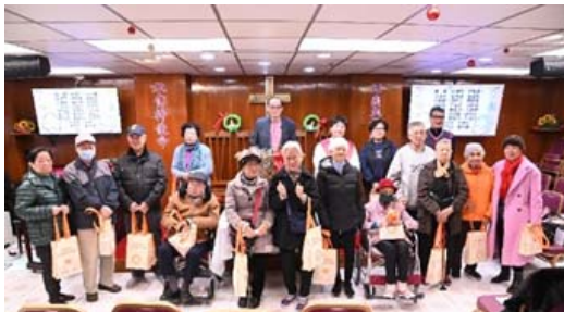
24/12 為長者送上福袋，以表敬意