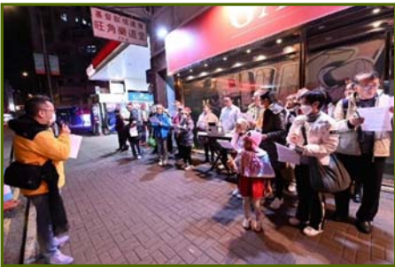
24/12 晚上在旺角區報佳音，有20人參與，將平安福音傳給旺角區居民。