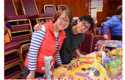
17/12 聖誕(家)年華，一共有六個攤位遊戲，聖誕點唱K及小食換領等