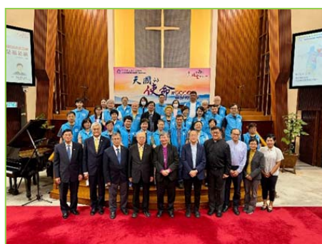
三堂肢體在 4/11 為香港華人基督教聯會培靈奮興大會作招待