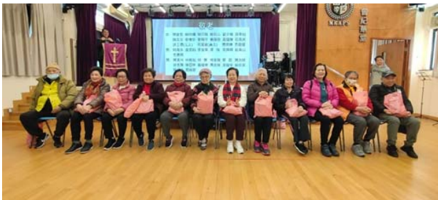
24/12 尊敬教會中的兄姊們，祝願他們身心靈健康