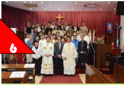
與聖馬可堂牧者合照