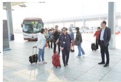
終於到了澳門口岸