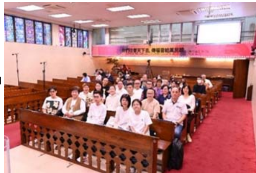
樂道堂肢體預備心靈參加崇拜