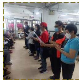
幸福小組與 晏架街街坊

及義工，於 14/12 在安老院【采晨琚】探訪，其間獻唱福曲及見證分享，將耶穌降生的福音帶給院友。