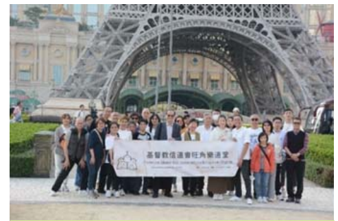
景點一個接一個，還有手信街