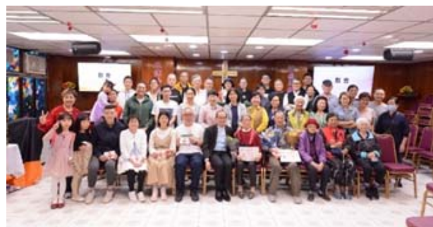
眾弟兄姊妹的支持