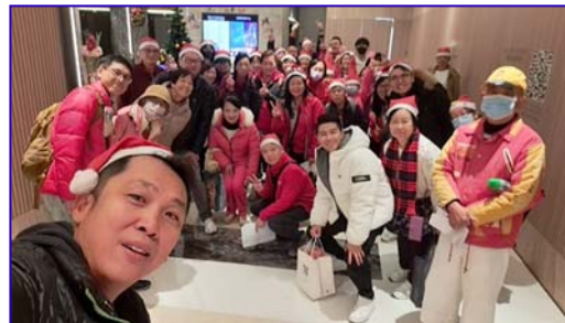
基督精兵整裝出發