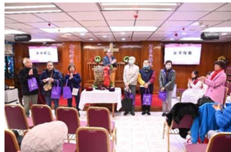
為新來賓及聖誕(家)年華後出席聚會者送上福袋