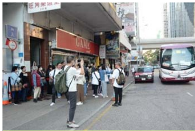
整裝待發，未出發先興奮