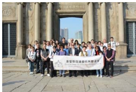
身心靈滿足後，參觀景點