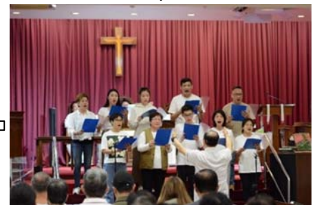
詩班獻唱【聖哉聖哉聖哉】