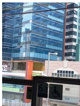
在牛頭角港鐵站 眺望觀塘道368 號外觀

在疫情期間,沒有實體崇拜,首先得知有學校可以出租作崇拜之用,隨後又得悉附近有新商廈可供認購,這些資料需要向會眾諮詢,因時間關係,一切資訊只能通過網絡發放資料和意向書給會眾決定是否租用學校以及是否購買新堂址作辦公室和日常聚會之用,在很短的時間之內,急需弟兄姊妹回覆意向書,在沒有面對面溝通的情況下,最終有多達九成會眾贊成,奉獻和貸款的金額亦達到購買所需要的資金,執事同工透過 ZOOM 網上進行特別會議,表決通過接納擴堂小組呈交購買觀塘道 368 號 3 樓 H 室(首選)作信道會合一堂堂址之計劃,並隨即啟動交易程序:於 28/4(四)上午簽署臨約,以及 6/5(五)下午到律師樓簽署正式買賣合約,在神帶領和大家齊心合力之下,事情就這樣成了。