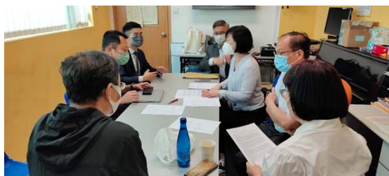
28/4(四)上午11:30簽署臨時買賣合約

感謝神帶領,祂垂聽禱告,祂的恩典豐足超過我們所想所求,在人眼中看似有點倉卒,在神沒有難成就的事,哈利路亞!將榮耀歸予厚賜百物的天父,神伸出祂施恩的手,在合適的時間為我們預備,耶和華以勒,哈利路亞!