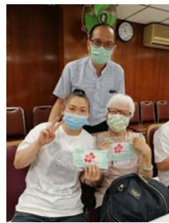
愛基金口罩(送長者及會友)

自吸引同心同行的義工/同工，成為我們的一份子，也成為我們愛基督的回應行動，更相信這是一個撒種收割的好時機。